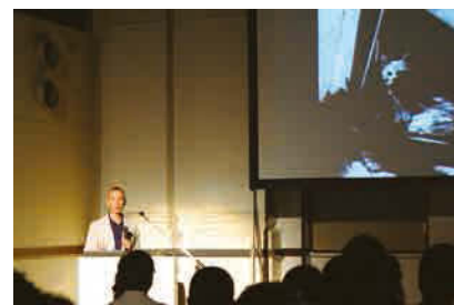
リビット水田堯「猫と犬のように——映画とカタストロフ」