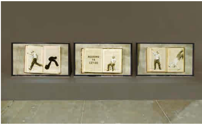
William Kentridge, NO, IT IS , 2012. Photo by Cathy Carver, courtesy of Marian Goodman Gallery, New York. © William Kentridge

「動くドローイング」とも呼ばれる素描をコマ撮りした手描きアニメーション・フィルムで世界的に知られた美術家。人形劇やオペラの舞台監督、俳優、演出家、著述家など多彩な分野でも活躍している。近年は複数の人々を巻き込む大規模な構成の作品が増えたが、あくまでも彼の作品は、スタジオ内での膨大な思索と手作業が集積されたアニメーションと彼自身の身体的思考が基本である。彼の母国である南アフリカの状況を、「自分のスタジオ」を起点として考察し、ヨーロッパ近代の知と技術史を手掛かりに、身体感覚を伴う堅実な歩みで人間の普遍的な問題を検証し、視覚的な表現へと昇華している。日本では2009-10年に京都国立近代美術館ほか2都市での大規模な個展の開催、2010年には第26回京都賞(思想・芸術部門)を受賞するなど、日本および京都との関係も深い。