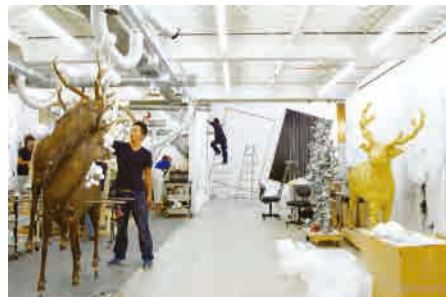
(上) SANDWICH スタジオ外観 (下) スタジオ内観