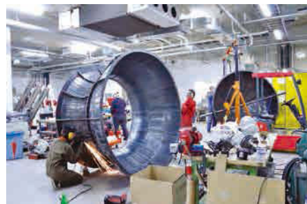
ウルトラファクトリー内部