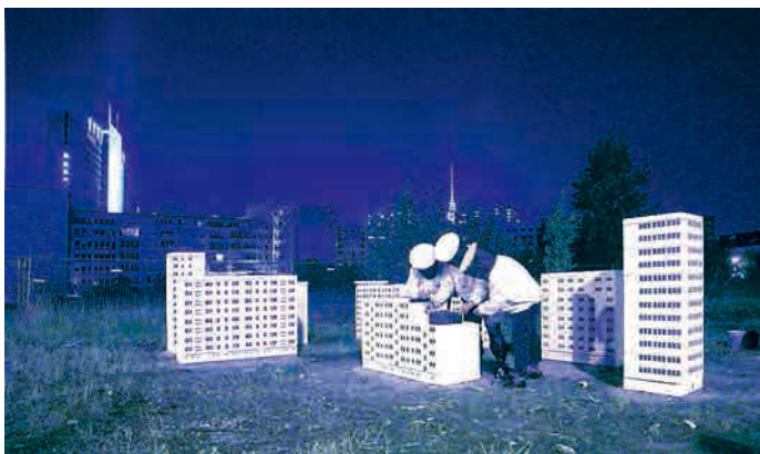
Hoefner/Sachs, Honey Neustadt , 2006.

フ란ツ・ヘフナー Franz Hoefner 1970年ドイツ・シュタルンベルク生まれ、ベルリン在住 ハリー・ザックス Harry Sachs 1974年ドイツ・シュトゥットガルト生まれ、ベルリン在住