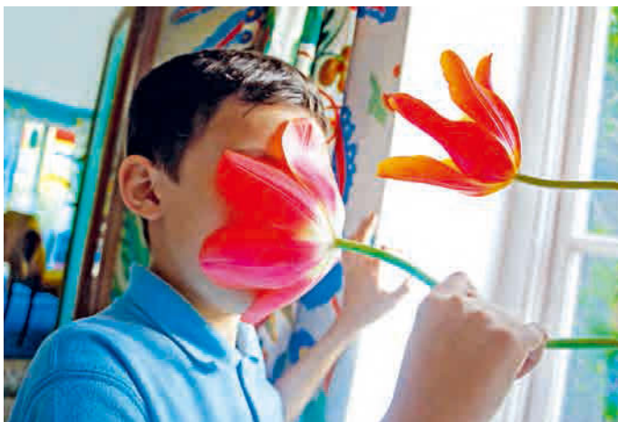
Pipilotti Rist, Mercy Garden Retour Skin , 2014. Audio video installation (photograph inspired by Yujij).

1962年スイス・グラープス生まれ、チューリヒ在住 www.pipilottirist.net