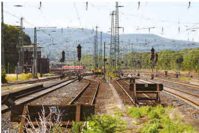
Susan Philipsz, Study for Strings , 2012. Installation view at Kassel Hauptbahnhof, Kassel.

1965年イギリス・グラスゴー生まれ、ベルリン在住 www.susanphilipszyouarenotalone.com