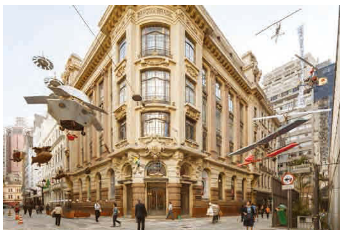
蔡國強「農民ダ・ヴィンチ」2013 サンパウロ、ブラジル銀行文化センター屋外での展示風景

1957年中国福建省泉州生まれ、ニューヨーク在住 www.caiguoqiang.com