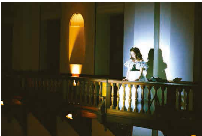
ドミニク・ゴンザレス=フォルステル 《M.2062 (Scarlett)》 2013年9月6日 PARASOPHIA: 京都国際現代芸術祭2015 オープンリサーチプログラム © Dominique Gonzalez-Foerster

1965年フランス・ストラスブール生まれ、 パリとリオデジャネイロを拠点に活動 www.dgf5.com