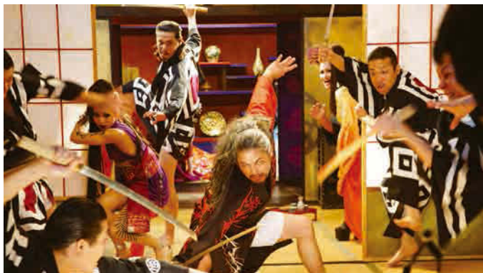
『ミロクローゼ』2011 監督・脚本・製作・編集：石橋義正