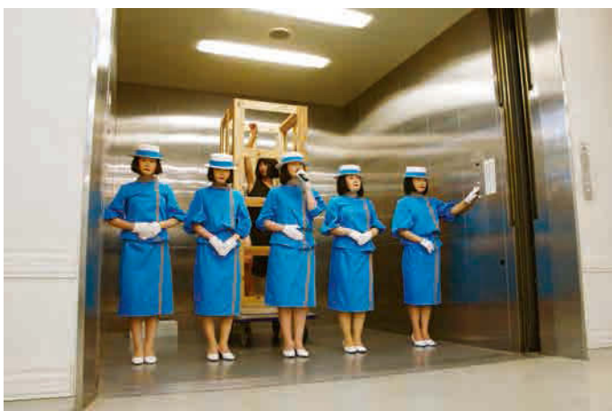
やなぎみわ演劇プロジェクト『1924 人間機械』 2012

グルノーブルの美術学校を卒業後、80年代後半から自身が「ルーム」と呼ぶ一連の部屋のインスタレーションを制作する。映像、光、音、家具などが組み合わせられるその作品は、知覚を通じて鑑賞者の記憶を刺激し、作品である室内を物語に満ちた本であるかのような空間に変容させる。彼女の作品は鑑賞者とのインタラクティブな関係を重視するだけでなく、作品状況を生み出す過程で生じる物理的・心理的構成要素の間の関係性、特に制作過程での人々の関与を重視しており、その作品はリレーショナル・アートとして分類されてきた。